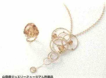
山梨県ジュエリーミュージアム所蔵品