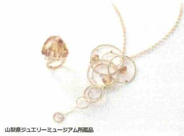
山梨県ジュエリーミュージアム所蔵品